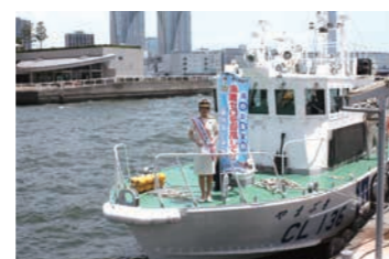
一日海上保安部長