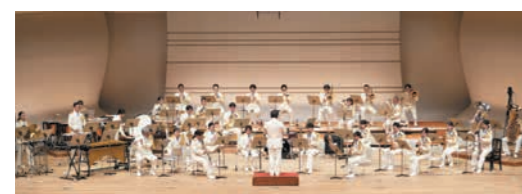
海上保安庁音楽隊定期演奏会