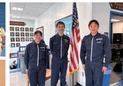
USCGA(米国沿岸警備隊)研修