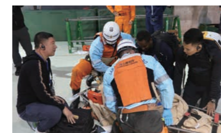
特殊救難隊との合同模擬訓練