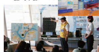
関門海峡での海上保安業務の説明