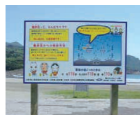
海浜事故防止啓発用立て看板