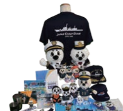
オリジナルグッズ