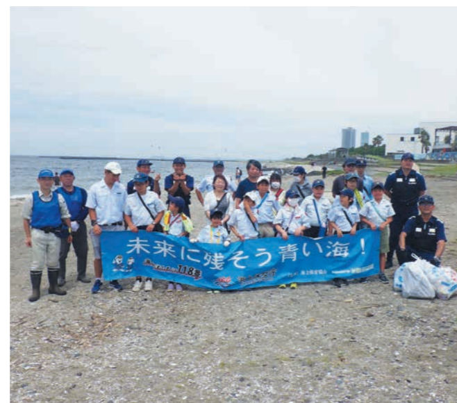
海上保安協力員による海浜等の清掃活動