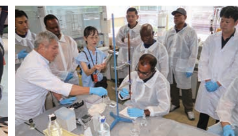
海上保安試験研究センターでの研修