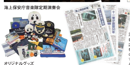
オリジナルグッズ

海上保安新聞 毎月3回程度発行、昭和24年の創刊以来3,400号を超えています。また、過去の貴重な紙面を電子化して保存する事業に取り組んでいます。