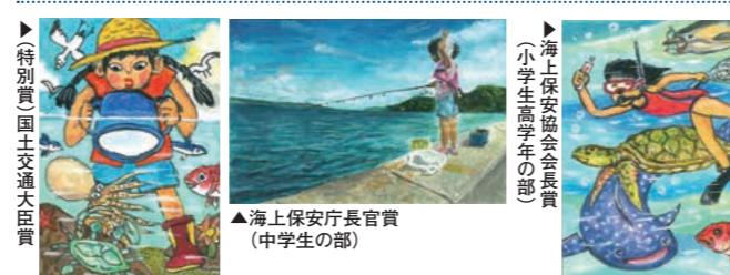
▶(特別賞)国土交通大臣賞