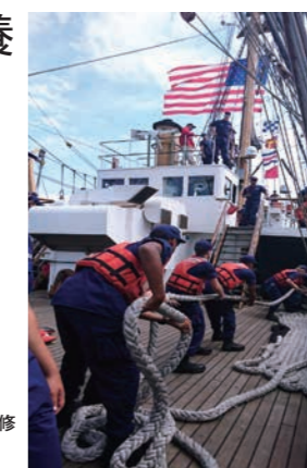
短期海外研修(米国沿岸警備隊)