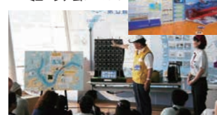
関門海峡での海上保安業務の説明