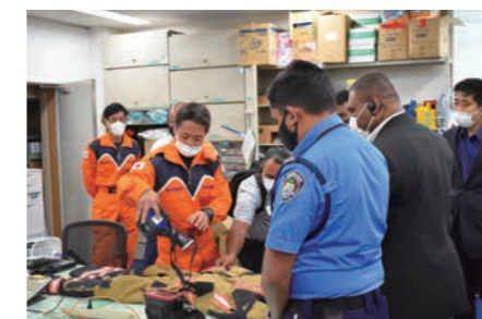
羽田特殊救難基地での研修