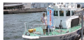
一日海上保安部長