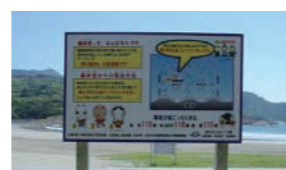
海浜事故防止啓発用立て看板