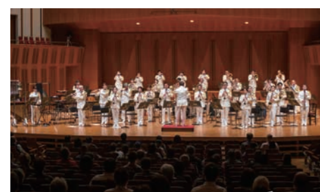
海上保安庁音楽隊定期演奏会