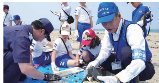
海上保安協力員による海洋環境教室