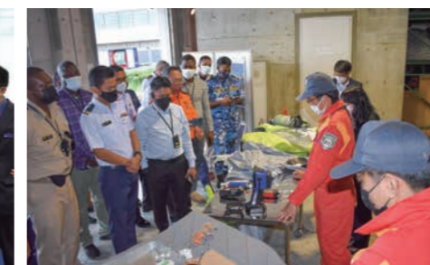
横浜機動防除基地での研修