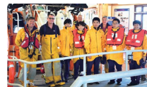
短期海外研修(英国王立救命艇協会)